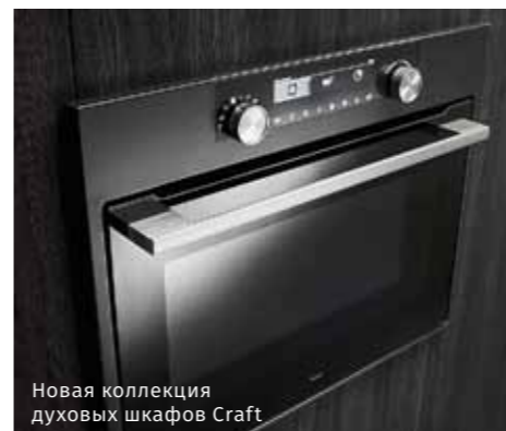
Новая коллекция духовых шкафов Craft